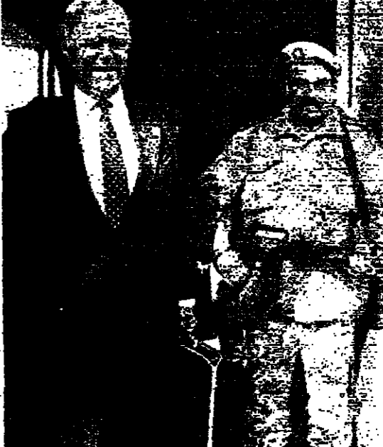
غولدينغ في بيروت (محمد عزراي)

في انتظار استكمال التحرك العربي حول لبنان. والذي تعطل بتوجه عضو اللجنة الوزارية الثلاثية وزير الخارجية السعودية الامير سعود الفيصل الى باريس. فواشنطن. ومع ترقب توجه الجنوب الاخضر الازرق الى الفتيان لاطلاق المسولين في الكريسي الرسولي على نتائج اجتماع الثلاثة. الاخير. تبوء الساحة اللبنانية في غلبان. اعلاي شرقا وغربا. في ضوء البلاغ الذي اصدره رئيس مجلس الوزراء العماد ميشال عون بوصفه وزيرا للاعلام بشأن ضبط القتلان. الاعلاي. والرود على هذا البلاغ. في وقت يقفز الجنوب الى واجهة الاضواء من جديد. مع وصول الاسلحة العلم لتساعد لزام المتحدة مارك غولدينغ الى بيروت للبحث في موضوع التجديد لقوات الطوارئ الدولية في الجنوب. وتزامن هذا الزيارة مع سقوط صواريخ. كاتيوشا. في الحزام الامني. وعلى مقربة من الحدود الاسرائيلية.